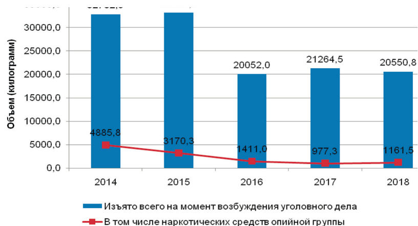
Рис. 1. Динамика изъятия наркотических средств на момент возбуждения уголовного дела в Российской Федерации

Как видно, с 2014 г. происходит снижение изъятия общего количества наркотических средств. В 2016 г. отмечено снижение количества изъятия наркотических средств в